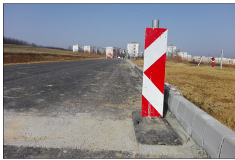
Szegélyeznek a Körtvélyest a Sikondai úttal összekötő Nagyrét utcában

Mecsekjánosiban további 70 méteres szakasz kerül burkolásra, amely biztosítja az épületekről érkező csapadékvíz elvezetését.