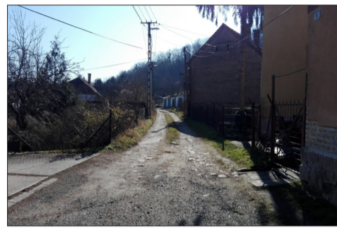
Márciusban a belváros legrégebbi utcái kerülnek aszfaltozásra

Az utca több réteg aszfaltot kapott a múlt évben, a záró aszfaltreteget várhatóan márciusban terítik le. Az út a tömegközlekedési útvonalnak is része lesz.