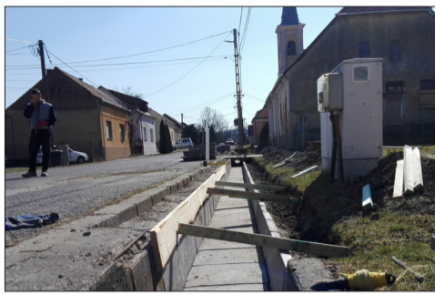
Az Iskola utcában folytatódik a vízvezető árkok rendbetétele

Az önkormányzat átadta a 14 férőhelyes parkolót, az autóbuszok leparkolhatnak már az új helyükön, ezért ismét változni fog a forgalmi rend.