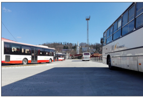
Átadták a Bem utcai buszparkolót a közlekedési társaság számára

Az önkormányzat átadta a 14 férőhelyes parkolót, az autóbuszok leparkolhatnak már az új helyükön, ezért ismét változni fog a forgalmi rend.